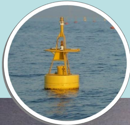
のり養殖区域を明示するための灯浮標（一例）

養殖施設の周囲及び漁場内には、灯浮標（ブイ）やのり網を固定するためのロープ等が多数張られており、近づくと絡網するおそれがあります。近づかないよう十分注意して下さい。