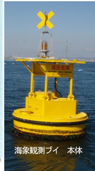
海象観測ブイ 本体